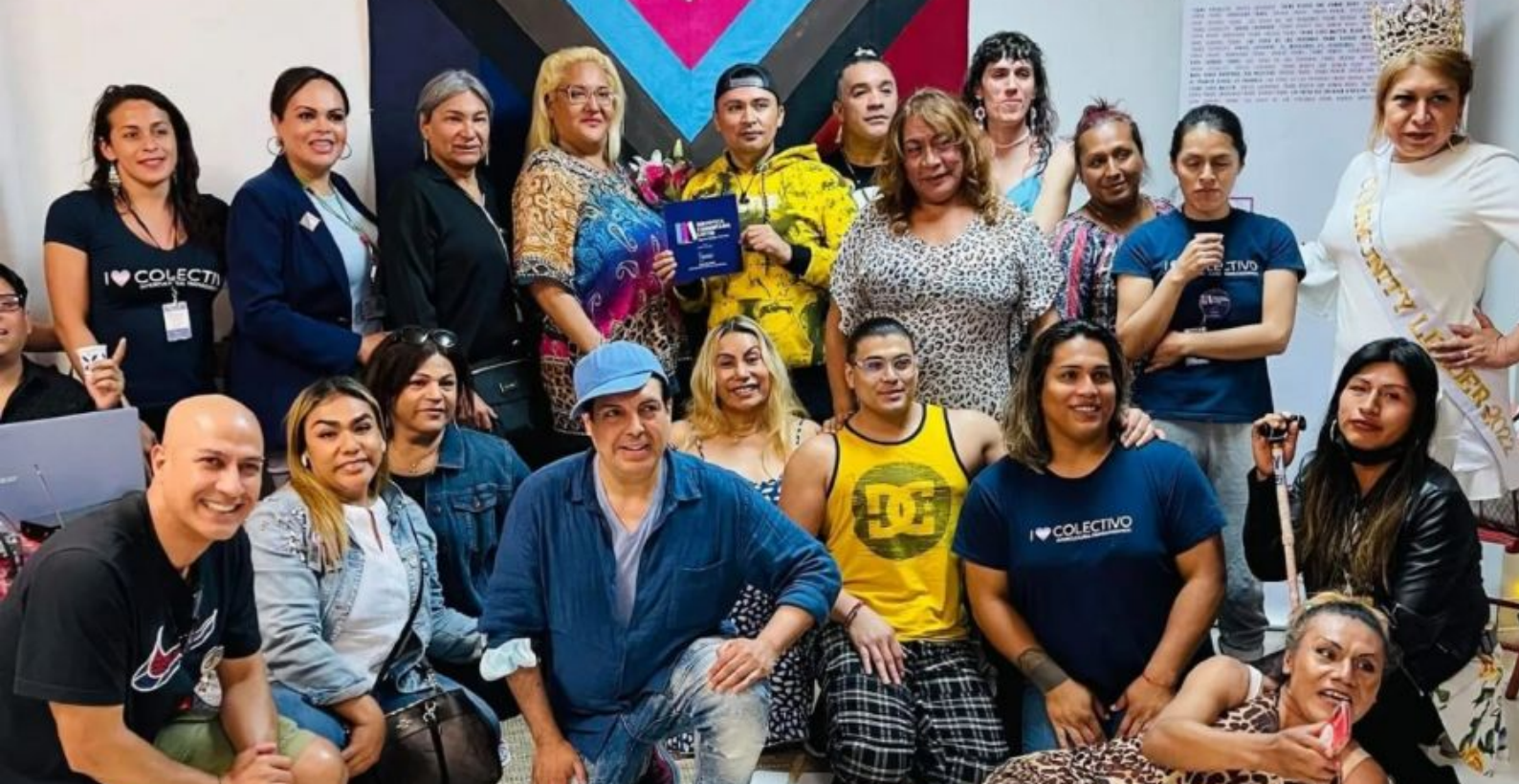
Fundadoras y miembros del CITG

Desde la persecución policíaca, hasta el abandono estatal y crímenes de odio, la comunidad latinex sufre discriminación en base al desconocimiento o dificultades con el idioma extranjero, dificultando la socialización de las mismas. Frente a éstas y otras problemáticas el CITG funda la biblioteca, la cual posee tanto libros en inglés, como libros en español (siendo estos últimos los predominantes). Esto se debe a que se busca que las personas latinex puedan ver en los libros otras formas de visibilidad del colectivo, más allá de los futuros vaticinados donde la muerte violenta se hace presente. Lleva el nombre de Belén Correa en un forma de reconocimiento en vida a la activista travesti argentina homónima, cofundadora de la Asociación Trans Travesti Transgénero Argentina (A.T.T.T.A) y creadora del Archivo de la Memoria Trans de Argentina.