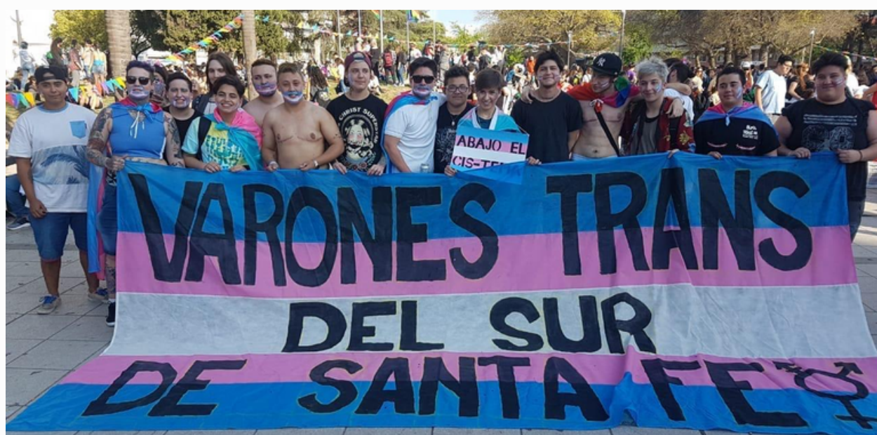
Varones trans del Sur de Santa Fe

Orlanda Jaramillo (2013) apunta a una superación de la dimensión educativa y cultural de la biblioteca, en vistas a una dimensión política, la cual caracteriza como contribuyente a la “transformación del sujeto y de la sociedad desde procesos de formación ciudadana” (Jaramillo, O., 2013, p.7).