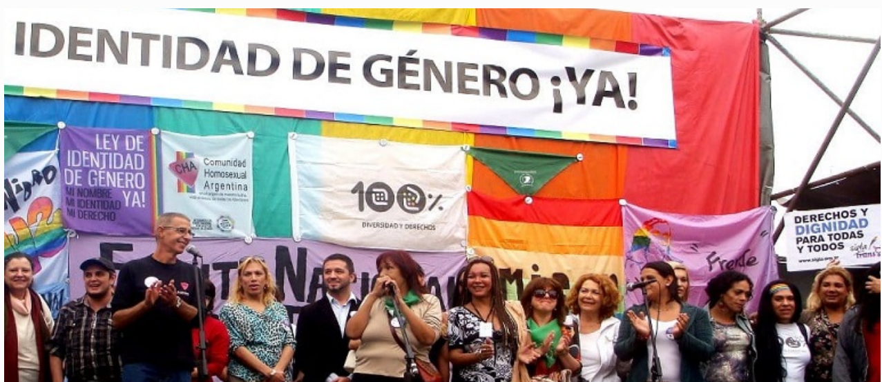
Votación Ley de Identidad de Género

Según el informe de impacto de la Ley N°26.743 de Identidad de Género realizado por A.T.T.T.A y Fundación Huésped (2013), en aquél momento en Argentina: 6 de cada 10 mujeres trans y 7 de cada 10 varones trans abandonaron sus estudios en el sistema formal debido a situaciones de discriminación perpetradas por el estudiantado, equipo docente y equipo directivo. Dicha cifra bajó luego de la promulgación de la ley en un estimado del 20% (veinte por ciento). Sin embargo, en un estudio realizado en 2016 por el bachillerato popular Mocha Celis y el Programa de Género y Diversidad Sexual del Ministerio Público de Defensa de la Ciudad Autónoma de Buenos Aires, arrojó que el 83,9% (ochenta y tres coma nueve por ciento) de la violencia sufrida por varones trans proviene de la institución escuela. Otra cifra alarmante, del estudio realizado en 2013 (ibid.) mostró que 5 de cada 10 varones trans y un tercio de la muestra de mujeres trans, pensaron e intentaron cometer suicidio, teniendo en promedio éstos 13 años y éstas 16 años.