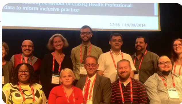
LGBTQ Users Special Interest Group

Al ser un grupo de trabajo perteneciente a la IFLA, cualquier persona asociada a ella puede acceder a formar parte y a utilizar sus servicios. El último trabajo publicado por el grupo de interés es sobre el abordaje de las identidades no binarias de pueblos originarios norteamericanos.