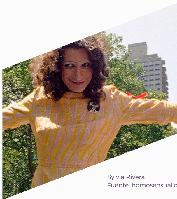
Sylvia Rivera