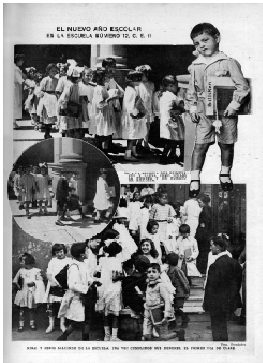
Figura 1: La revista y el guardapolvo blanco al comienzo del nuevo año escolar. Billiken , N° 17, 8 de marzo de 1920.