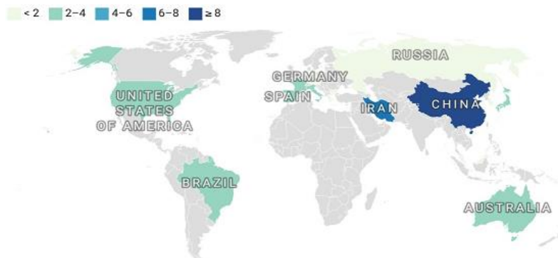
شکل ۳. فراوانی مطالعات مورد بررسی به تفکیک کشورها

از جنبه فراوانی مطالعات انجام شده به تفکیک کشورها، از بین ۴۰ مطالعه مورد بررسی، بیشترین مطالعات توسط پژوهشگران چین (۹ مطالعه)، و سپس ایران (۶ پژوهش) انجام شده است. پژوهشگران کشورهای آمریکا، ایتالیا و اسپانیا (هر یک با ۳ مطالعه) و فرانسه، برزیل و استرالیا (هر کدام با ۲ پژوهش) در رده‌های بعدی قرار دارند. سایر کشورها از جمله کره، مالزی، بلغارستان، آلمان، اتریش، یونان، پرتغال و روسیه هر کدام با یک مطالعه در این حوزه موضوعی فعال بودند (شکل ۳).