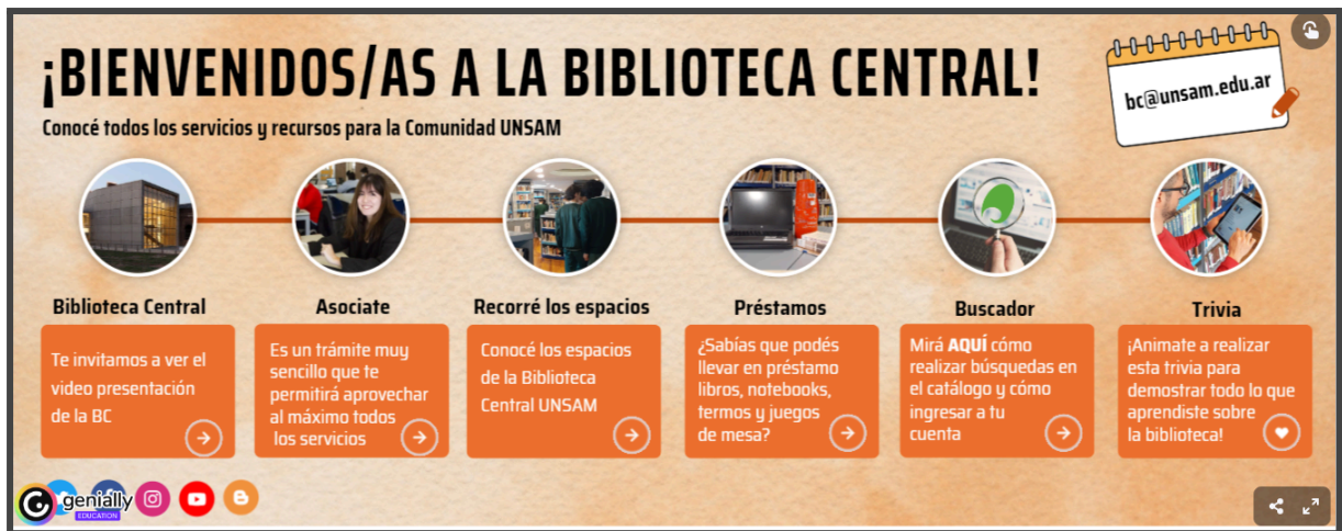
Imagen 1: Recorrido interactivo: Conocé tu Biblioteca, realizado con la herramienta Genially

- Cajas de Herramientas personalizadas que incluyen una selección de recursos y servicios específicos para cada perfil de usuario: estudiantes del CPU - ingresantes, estudiantes de intercambio, tesis, docentes, investigadores, estudiantes de posgrado, estudiantes de grado.