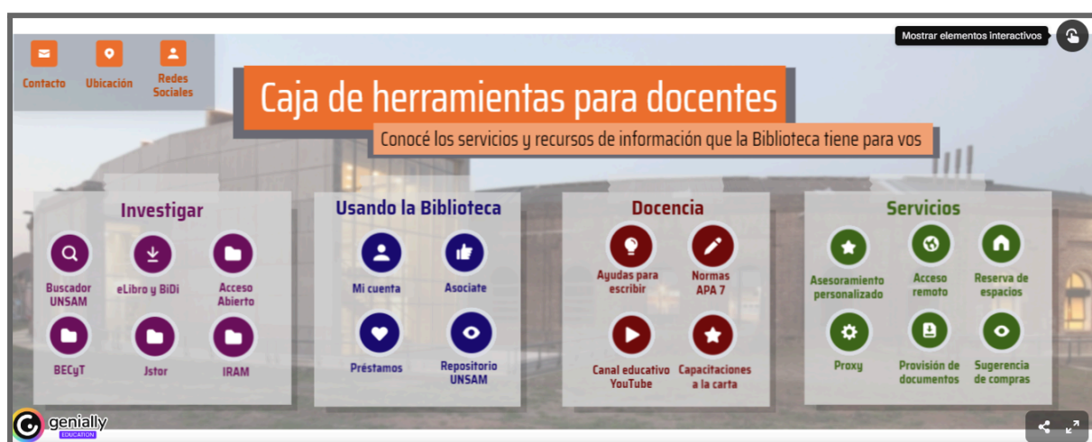
Imagen 3: Visualización de la Caja de herramientas para docentes.