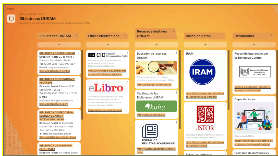
Imagen 4: Tablero de las Bibliotecas UNSAM realizado en Padlet

Estos tres elementos diseñados tienen en común la facilidad de acceso, resultan visualmente más atractivos que el sitio web, si bien los enlaces remiten a él para completar la información, y además ofrecen la posibilidad de sintetizar y enlazar información que, de otra manera, no es tan sencillo de explicar o desarrollar en un mismo espacio.