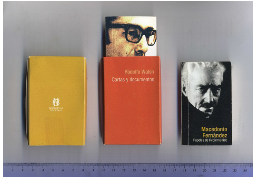
Imagen 1. Libros de la colección Libros del Bicentenario , edición 2014.