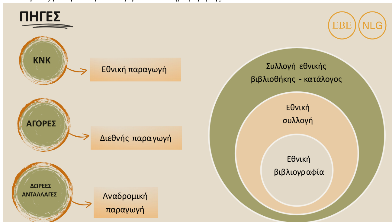
Σχήμα 1. Σχέση μεταξύ Καταλόγου - Εθνικής συλλογής - Εθνικής βιβλιογραφίας.

Στο πλαίσιο της παρούσας εργασίας, και λαμβάνοντας υπόψη τα όσα έχουν καταγραφεί μέσα από τη βιβλιογραφική έρευνα, καταγράφονται οκτώ υπηρεσίες-ρόλοι που οφείλει να προσφέρει μια σύγχρονη ΕΒ στο πλαίσιο δεδομένων συνθηκών όπως αυτών στην Ελλάδα, λαμβάνοντας υπόψη το σύγχρονο και διαρκώς μεταβαλλόμενο περιβάλλον πληροφόρησης.