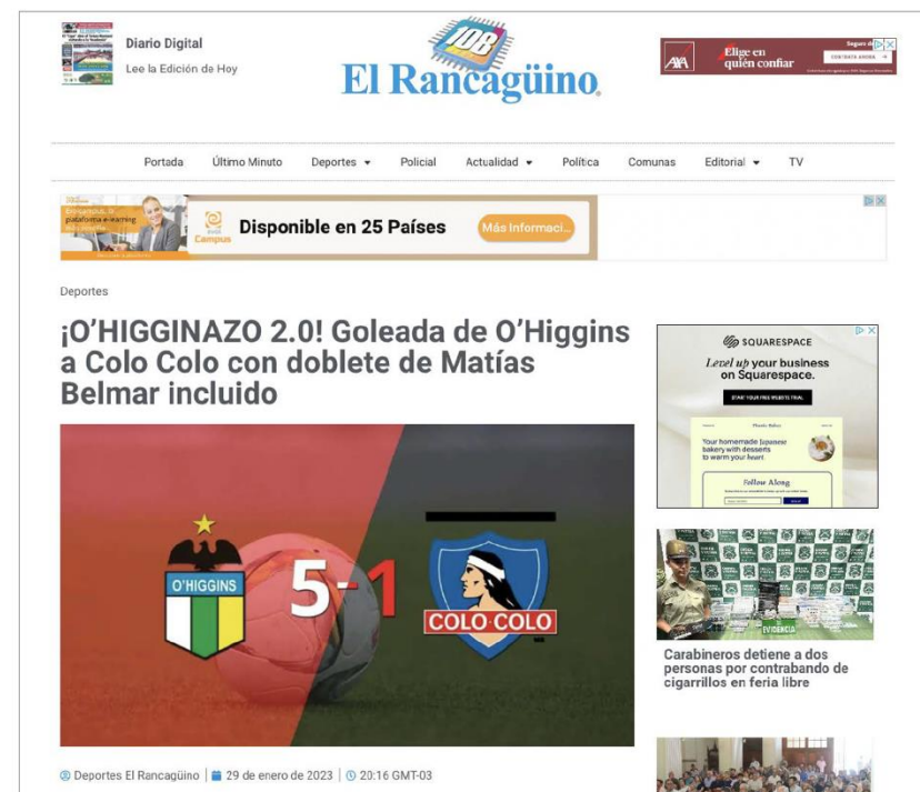
Figura 2. La crónica del triunfo de O'Higgins 5 a 1 sobre Colo Colo es el artículo con redacción IA más leído en el periodo estudiado (786 páginas vistas según Google Analytics). (Deportes El Rancagüino, 2023a).

Redacción humana: páginas vistas, tiempo promedio en la página, extensión y presencia en portada.