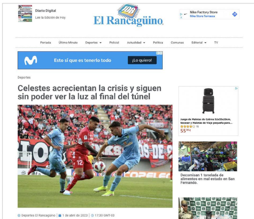
Figura 1. La crónica de la derrota de O'Higgins 1 a 2 ante Ñublense sobre es el artículo con redacción humana más leído en el periodo estudiado (1.151 páginas vistas según Google Analytics). (Deportes El Rancagüino, 2023b).

Redacción humana: páginas vistas, tiempo promedio en la página, extensión y presencia en portada.