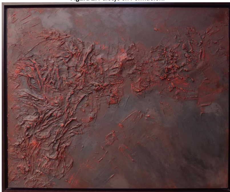
Figura 2: Paisaje en Formación.

que esto puede entrañar. Este es un sentimiento de atracción fatal que nos lleva a admirar, y al mismo tiempo temer, la fuerza de la naturaleza y que nos paraliza ante la grandeza de lo sublime.