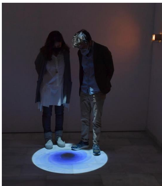
Figura 3: Vortex.