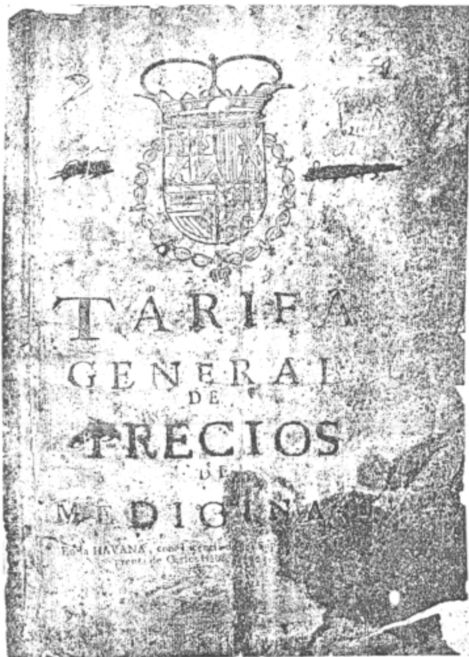
FIG. 1. Primera obra impresa en Cuba.