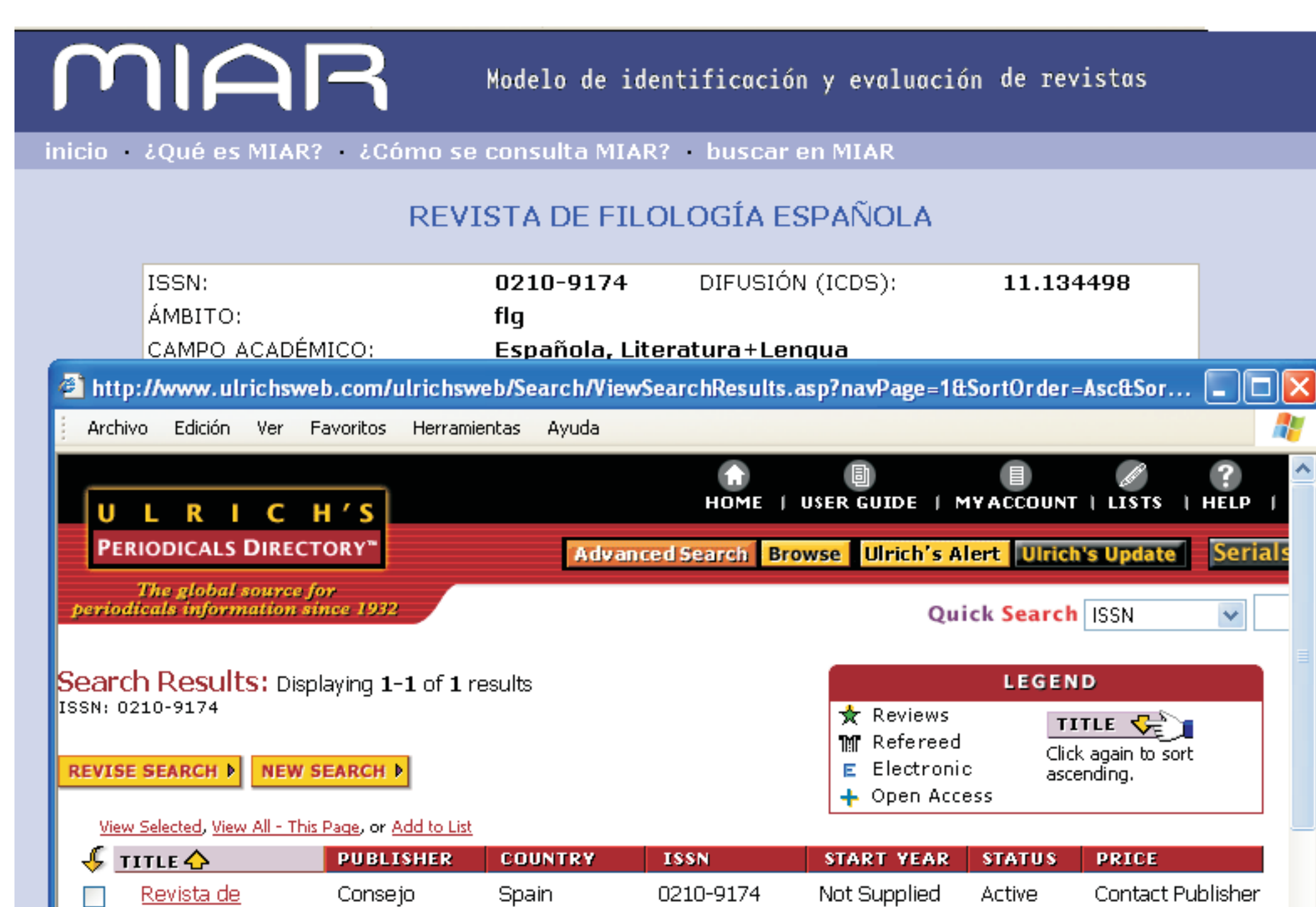
Fig. 4 Enlaces a repertorios explotados en MIAR [URL a Ulrich]