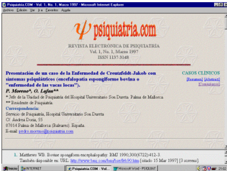
ARTICLE DE LA REVISTA ELECTRÒNICA PSIQUIATRIA.COM.

Actualment són dues les revistes que inclou aquesta web: Psiquiatria.COM (ISSN 1137-3148, http://www.psiquiatria.com/psiquiatria ) i Psicologia.COM (ISSN 1137-8492, http://www.psiquiatria.com/psicologia ). La subscripció a aquestes dues publicacions és gratuïta, la qual cosa demostra que sí que es possible que les revistes electròniques de qualitat siguin accessibles sense haver de pagar, únicament cal experimentar noves formes de finançament. Aquestes publicacions són trimestrals, amb una extensió equivalent a unes 120 pàgines en cada número, i consten de les següents seccions: editorial, originals, articles de revisió, article especial, casos clínics i comentaris i crítiques de llibres i articles. Així mateix existeix un comitè editorial, un comitè assessor i un comitè de redacció; els articles són revisats i seleccionats per a la publicació.