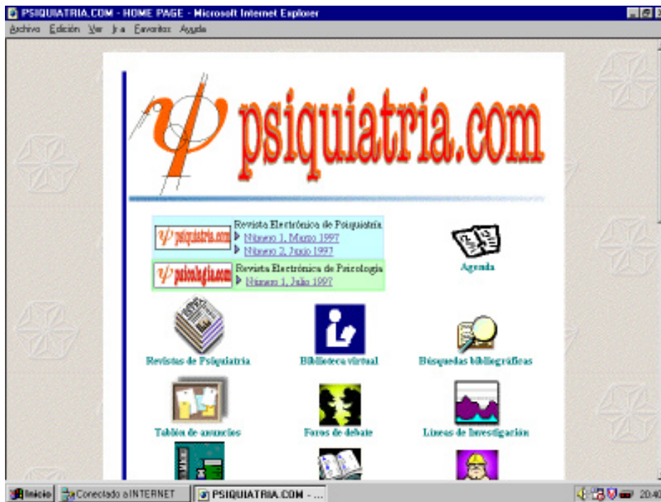
PÀGINA PRINCIPAL DE PSQUIATRIA.COM.

La web Psiquiatria.COM ( http://www.psiquiatria.com ) és un servei d'informació electrònica especialitzat en psiquiatria i ciències afins, creat per l'empresa espanyola Inter-Salud ( http://www.intersalud.es ) i patrocinat pel laboratori farmacèutic Bristol-Myers Squibb ( http://www.bms.com ). L'interès creixent del fenomen Internet entre els professionals de la Psiquiatria, com es demostra a partir de treballs com el de Huang i Alessi (1996), dugué tres prestigiosos psiquiatres espanyols a idear la creació de Psiquiatria.COM, en considerar les possibilitats que té Internet en la comunicació científica.