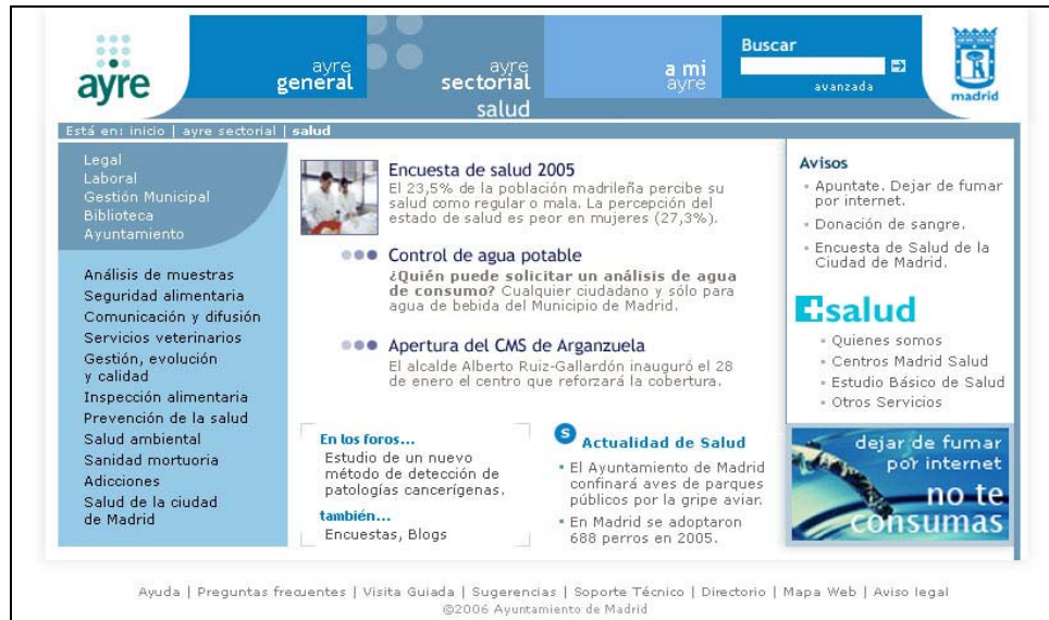
Figura 3. Página principal de la Intranet sectorial “ayre salud”