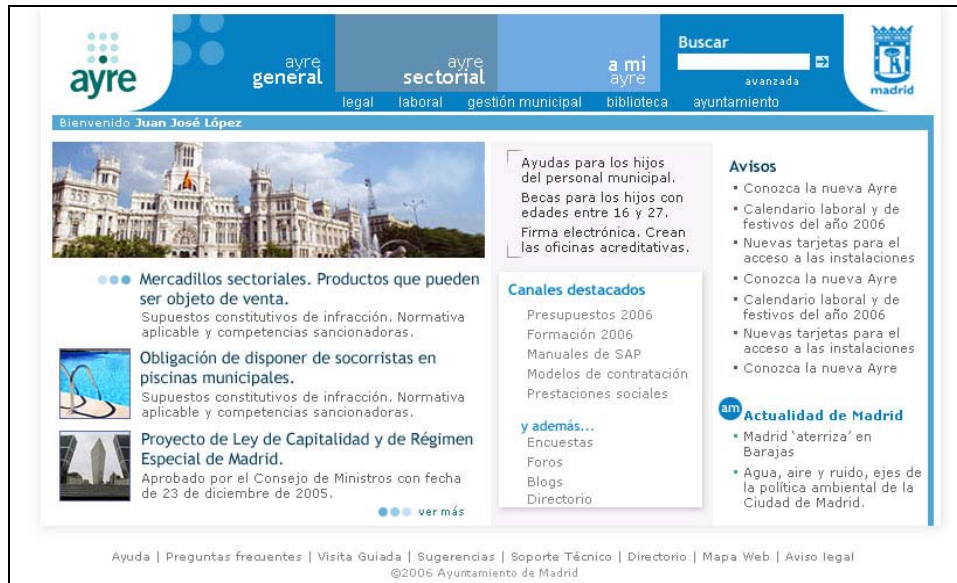
Figura 2. Página principal de la Intranet