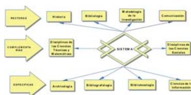
FIG. 1. Sistema bibliológico-informativo, según el Dr. Emilio Setién .

En este último punto, Setién y Gorbea , principales teóricos del sistema bibliológico- informativo, como denominaron a este conjunto por razones ampliamente justificadas en diversos trabajos 39 bajo el paradigma multi-interdisciplinario y multisectorial de la información, reconocen disciplinas rectoras, complementarias y específicas, y definen una disciplina como “un cuerpo teórico, cualitativamente diferenciado de otros, en tanto se ocupa de un fenómeno distinto, específico, que presenta leyes propias en su desarrollo” 40 (fig. 1).