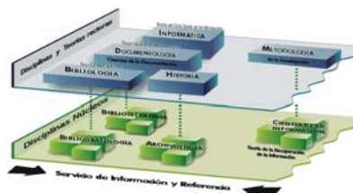
FIG. 2. Modelo de relaciones interdisciplinarias de sistema de conocimientos científicos bibliológico-informativo, según el Dr. Salvador Gorbea .

Gorbea , en cambio, en su tesis doctoral 43 mantiene igual estructura con cambios mínimos en cuanto a las disciplinas rectoras. Donde Setién incluye la comunicación, Gorbea menciona la documentología (teoría del documento). Por otra parte, Gorbea asume como disciplina rectora la informática, mientras Setién la incluye, en sus inicios, como término utilizado por Mijailov y la reconoce como una misma disciplina con dos nombres: informática para los antiguos teóricos soviéticos, y ciencia de la información en el área anglosajona (fig. 2).