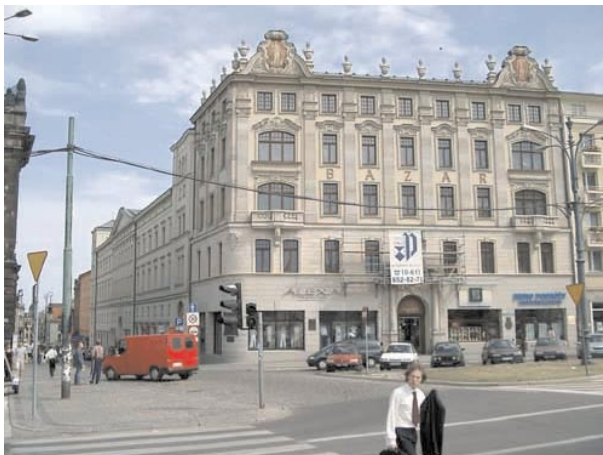
Poznań – Hotel BAZAR

VIII Zjazd Bibliotekarzy Polskich – Poznań, 25-27 września 1980 r.: