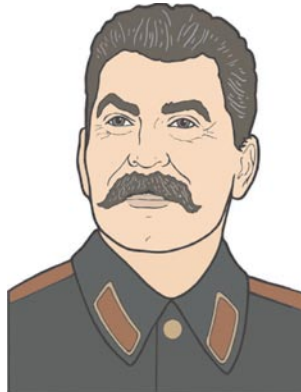
Józef Stalin (1879-1953)