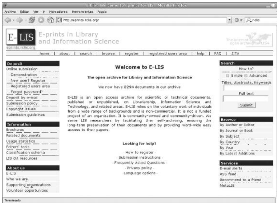
Figura 3. E-LIS

Las aplicaciones de software libre para repositorios institucionales no responden a un modelo tecno-sociológico que se ha tenido por genérico para este tipo de programas, y cuyas características serían la de estar soportados por pequeños grupos de desarrollo, con escaso apoyo institucional, y con una actividad discontinua, lo que puede incidir en la calidad y la sostenibilidad del software resultante. Chawner (2005) ha demostrado que, en el caso de los repositorios institucionales, precisamente, el modelo es diferente. Las múltiples herramientas han surgido, y se están llevando a cabo, en un entorno corporativo, gracias a proyectos de investigación que han obtenido financiación de administraciones públicas, principalmente. Por esta razón, disponen de equipos de desarrollo de software bastante estables, lo que asegura la mejora e innovación de las prestaciones del software. Las organizaciones que apoyan los proyectos son de alto nivel, e implican a universidades, centros de investigación y bibliotecas universitarias.