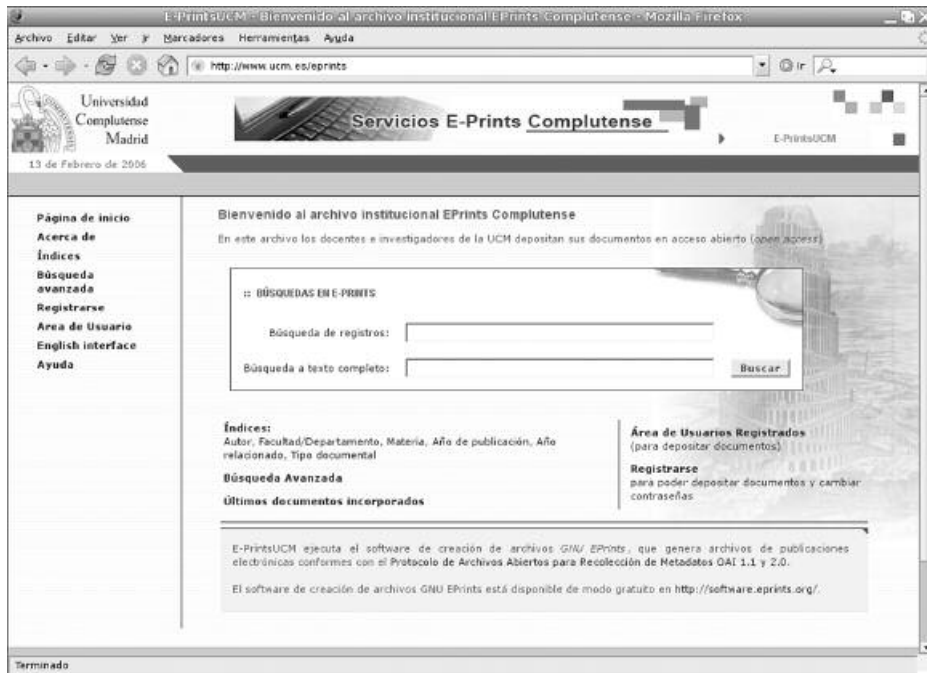
Figura 4. Eprints en la Universidad Complutense