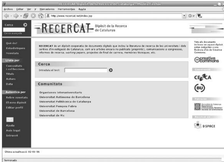
Figura 5. DSpace en Recercat

—Definición de la colección digital: características de los documentos, niveles de procesamiento de la información. Requerimientos técnicos.