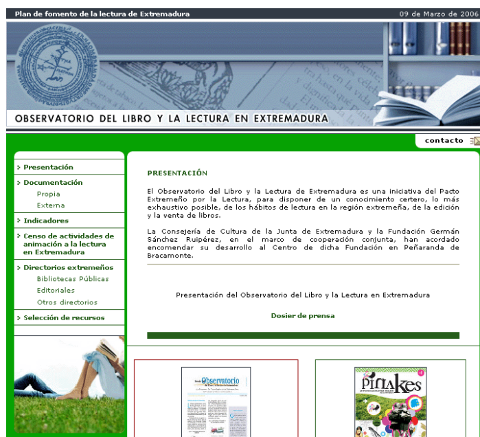
Figura 1. Observatorio del Libro y la Lectura en Extremadura.

El primero de estos servicios es una selección de documentación relacionada con los ámbitos de actuación del Observatorio —libro, lectura, bibliotecas y edición— dividida en dos secciones. La primera de ellas, la documentación propia , está constituida la primera por aquellos documentos generados en el marco del propio proyecto, de los que ya se habló en el anterior apartado, a saber: los barómetros periódicos, informes puntuales y los diferentes números del Boletín del Libro y la Lectura de Extremadura , todos ellos en formatos de fácil descarga e impresión.