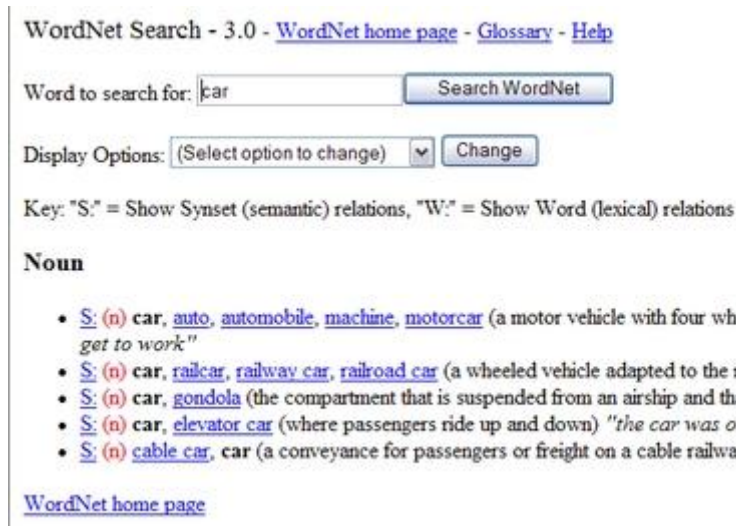
Imagen 2: Ejemplo de información semántica facilitada por WordNet.