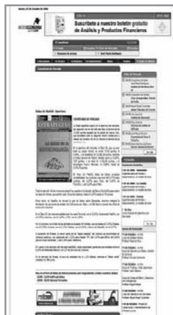
Figura 1. SP de Intereconomia.com , ejemplo del modelo A