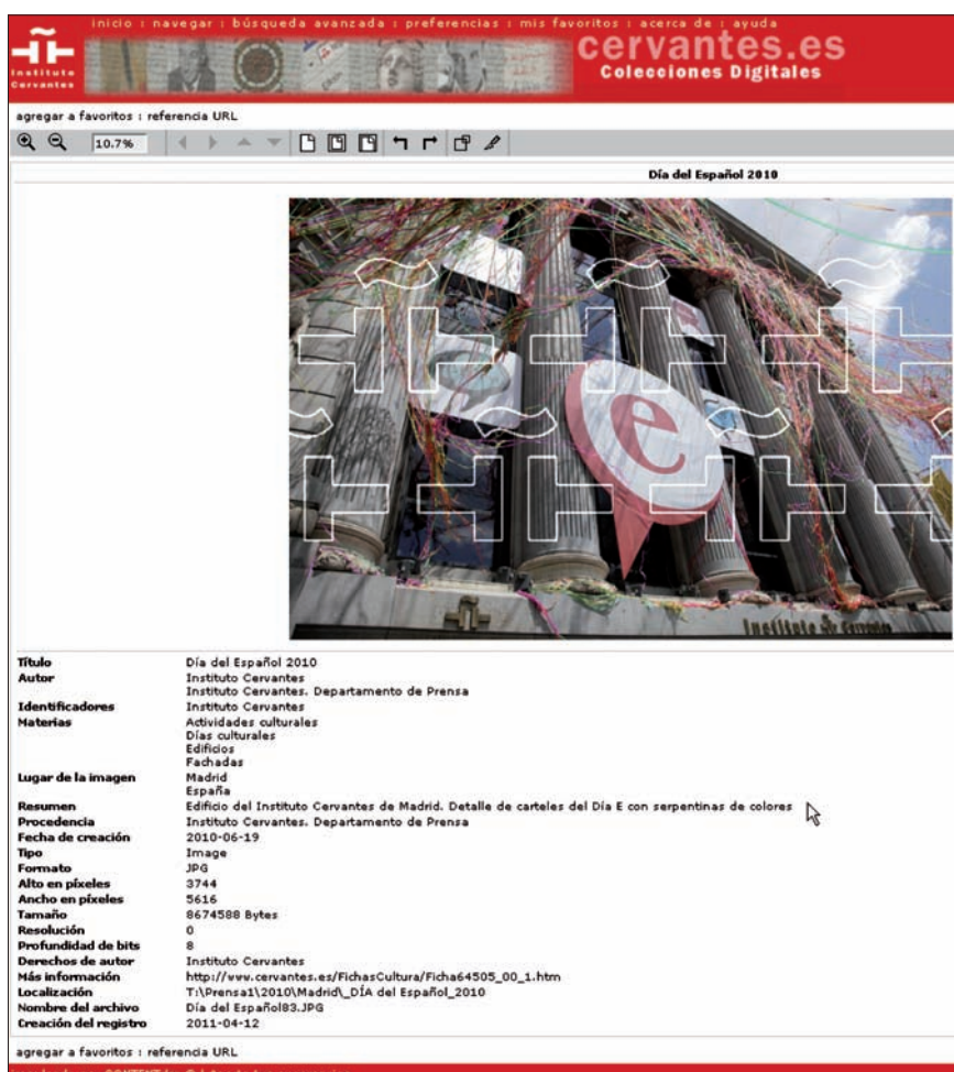
Presentación de resultados

Se ha presentado una doble necesidad en la gestión de las imágenes en el IC: la pública y la corporativa