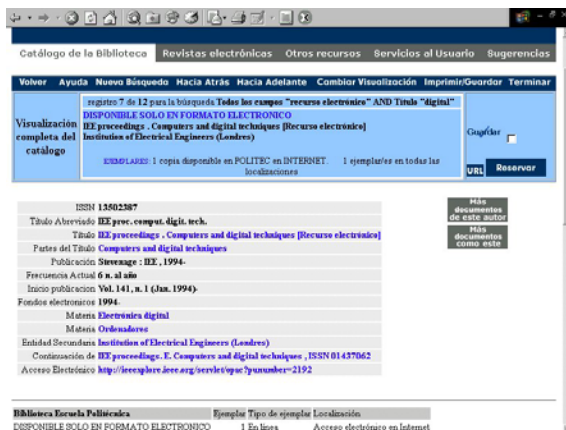
Fig. 2. Registro bibliográfico relativo a una publicación electrónica. Biblioteca de la Universidad Carlos III de Madrid http://ieeexplore.ieee.org/servlet/opac?punumber=2192

Además de esta circunstancia, también es habitual en las bibliotecas universitarias, la inclusión de un directorio o índice de recursos basado en las materias o disciplinas que se imparten en las distintas universidades, llegando en algunos casos a crear un sistema de recuperación específico con una estructura de información local, para estos recursos. Este es el caso, por ejemplo, del servicio REI (Recursos Electrónicos de Información) que mantiene la biblioteca de la Universidad de La Rioja (Fig. 3), donde sobre una base de datos en FileMaker, se clasifican por materias los recursos de carácter científico, convirtiendo el tradicional “enlaces de interés”, que repiten casi todas las bibliotecas universitarias, en un servicio de búsqueda por palabras clave.