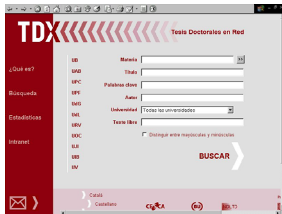
Fig. 5. Búsqueda en TDX (Tesis Doctorals en Xarxa). http://www.tdx.cesca.es/index_tdx_cs.html

En cuanto a la descripción de información local digitalizada, es importante destacar el reciente servicio TDX ( Tesis Doctorals en Xarxa ), coordinado por el Consorci de Biblioteques Universitàries de Catalunya (CBUC) (Fig. 5). El CBUC, ha mostrado desde hace mucho tiempo la necesidad de plantear políticas de tratamiento de la información electrónica (así lo demuestran por ejemplo estudios como el de Núñez [2000] y la existencia desde 1999 la Biblioteca Digital de Cataluña), pero en este caso TDX implica el tratamiento de documentos digitalizados, concretamente las tesis doctorales leídas en las universidades de Cataluña principalmente. Uno de los aspectos más importantes de este servicio es que pertenece al proyecto mundial NDLTD ( Networked Digital Library of Theses and Dissertations ) donde, además de la búsqueda en el catálogo albergada por VTLs, se está ensayando la búsqueda “federada” (es decir, la búsqueda unificada de recursos distribuidos) a través del protocolo OAI 33 .