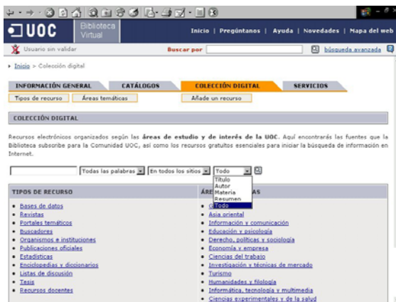
Fig. 4. Búsqueda en la Colección digital de la biblioteca de la UOC http://xina.uoc.es/esp/index.html?cdigital/index

la biblioteca de la Universidad Oberta de Catalunya (UOC) donde además del catálogo convencional, permite la consulta de su “fondo digital”, entendiendo por tal bases de datos, revistas a texto completo, enciclopedias, estadísticas y otros recursos de Internet y recursos propios digitales: por ejemplo, conferencias de Manuel Castells (en texto o audio), artículos de su personal docente e investigador, libros digitalizados, etc. Las búsquedas se pueden acotar a los campos de autor, título, materia y resumen, lo que implica que, aunque no exista un modelo de metadatos formal, los recursos digitales de acceso remoto se seleccionan y se describen en función de estos campos, pudiendo distinguirse: proceso de catalogación y el catálogo tradicional, y proceso de descripción de recursos electrónicos, y catálogo de fondo digital.