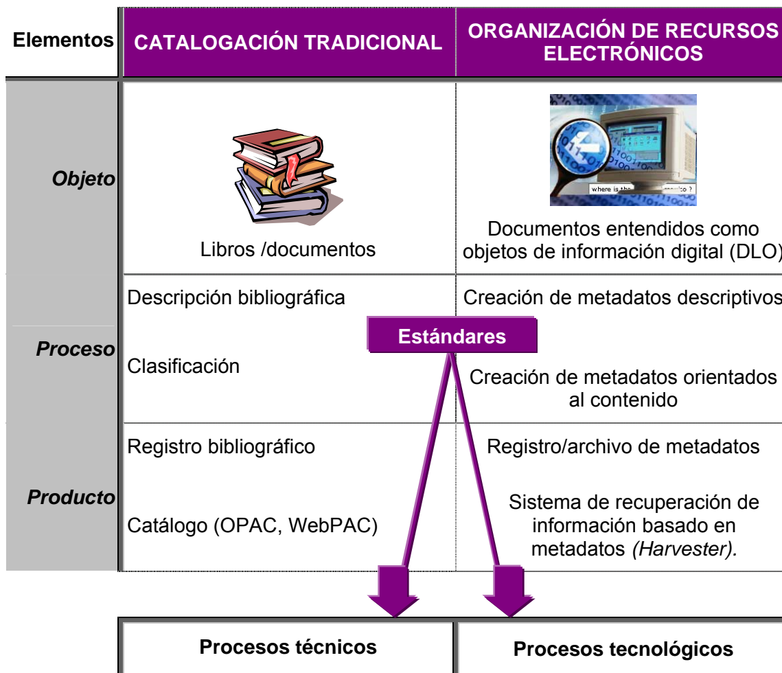
Fig. 1. Catalogación tradicional vs. organización de recursos electrónicos: Comparación de elementos constitutivos [elaboración propia].